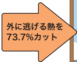
アルミ枠 + 単板ガラス