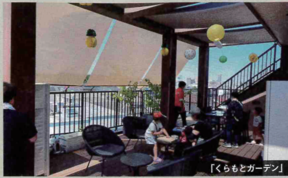
「くらもとガーデン」

くらもとBASEの広大な地下スペース（くらもとシアター）で開催された子ども向けの木工教室やワークショップの様子。毎月第一土曜日、地域住民に対して映画上映会も開催する※写真は本年開催の「夏祭りイベント」