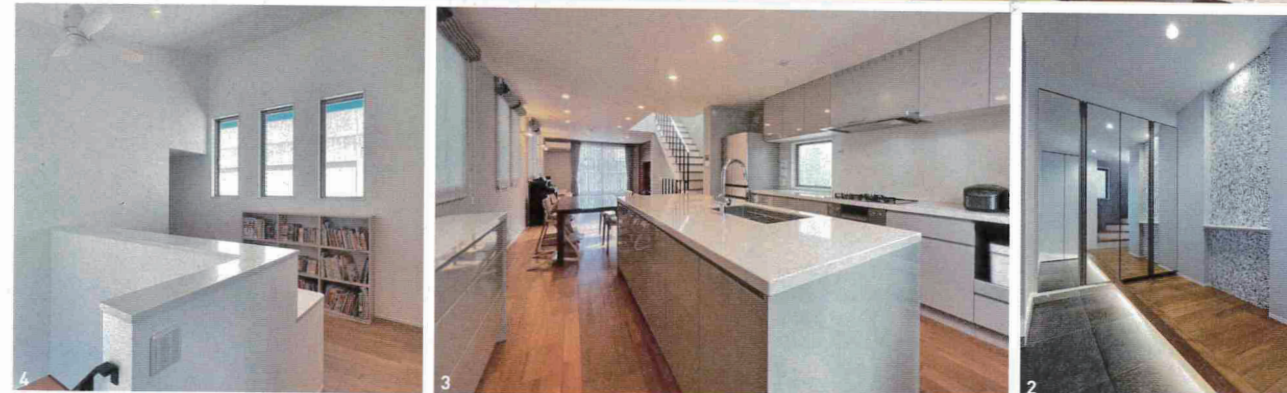
1～3 / 両側に隣家が迫る細長い敷地で都市型住宅をプランニング。家事動線を考慮したレイアウトで、キッチン奥には作業を効率化するユーティリティスペースを設置。モザイクタイルのアクセントウォールがある玄関など、高級感あふれる住まいに 4 / 吹き抜けに面した3階廊下には3人のお子さまのスタディコーナーも設置した (写真はO邸)