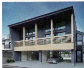
ショールームから徒歩3分で完成見学会を同時開催「くらもとテラス」

上で紹介する杉並ショールーム（くらもとBASE）では、随時見学や無料プラン相談を受け付けている。そのほか、徒歩圏内にある完成物件でも随時見学を受け付けている。ガレージハウスの施工例で、人気を博している。まずはご予約のうえ、見学に訪れてほしい。