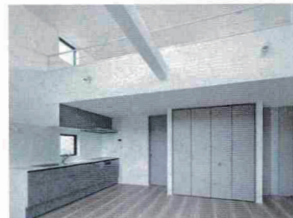
室内はSE構法ならではの大空間に

※株式会社LIXIL主催「LIXILメンバーズコンテスト」において、2012年度～2022年度の10年連続で受賞している（2020年度は中止）