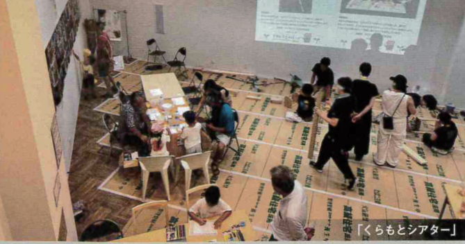
「くらもとシアター」