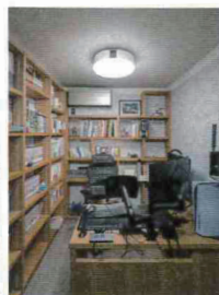
地下に設けた書斎。プラスαの空間が夢を叶えた