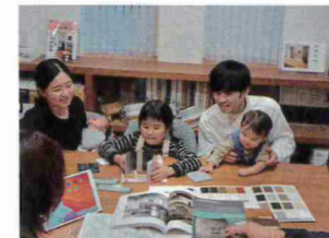
個別に行われる「無料プラン相談会」