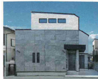
外壁タイルが目を引き。二世帯住宅だが地下活用でゆとりある暮らしを実現した

正式社名 (株) ハウステックス 住所 東京都杉並区永福 4-13-3 TEL 03-6379-5960 URL http://www.housestecs.co.jp